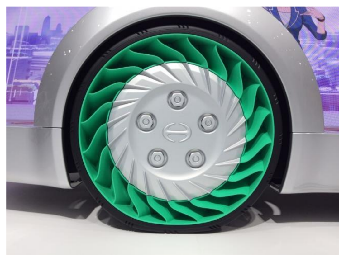
日野自動車: FlatFormerの「エアスタイヤ」モデル 出展協力: (株)ストラタス・ジャパン HP

5. 15:25 「FlatFormerが叶える、日野が思い描く豊かな未来」 日野自動車株式会社 デザイン部 創造デザイン室 室長 関口 裕治